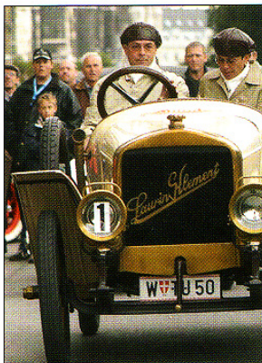
Fahrzeuge aus über sieben Jahrzehnten Automobilgeschichte

Glanzvolle Momente. Der Vormittag steht ganz im Zeichen der „Sportlichkeit“. Um 9 Uhr fällt beim Donauturm im Donaupark der Startschuss. Alle 30 Sekunden wird ein Fahrzeug auf die Strecke geschickt. Auf der Fahrt durch den Wienerwald beweisen die Automobile von anno dazumal, was sie noch alles drauf haben. Ca. ab 12 Uhr treffen die „Schmuckkästchen auf Rädern“ schließlich nach und nach zur