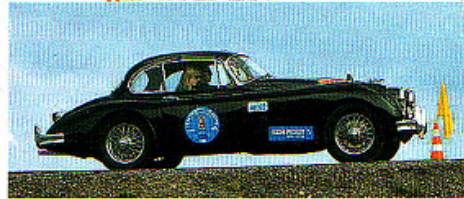
Die „Semperit“. Original-Streckenkarte 1972 (o.), Teilnehmer an der Neuauflage (li.)