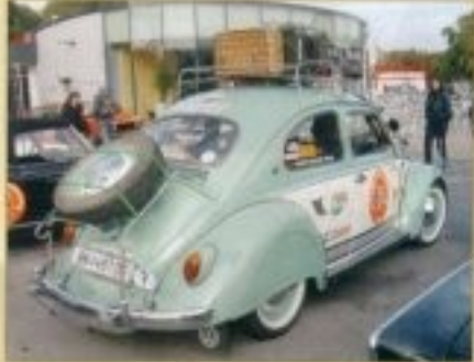
Ahol megelérk, úttól akart ami Lucie de Thelo Galax, nyelvel-ker "VW bogara. Bár azt ok sem tudják pontosan, hogy mit is akartak az állig leforgóvesseli csatlakozással meghódítani, de tény, hogy kétszer utyanon távolulak, mint egy hátrébről bogarot...