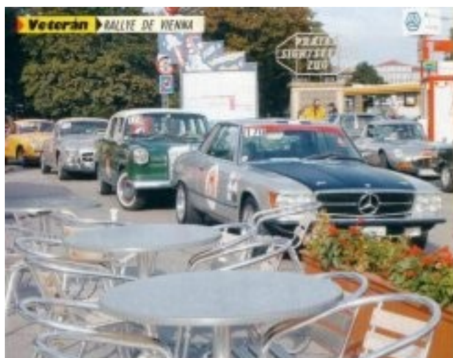
Veterán RALLYE DE NYENKA