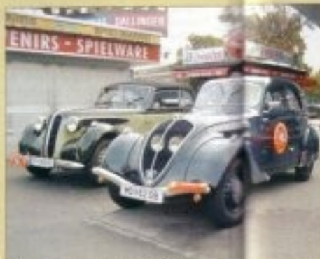
Két gyönyörűség a hátrébről 100kból. Egy BMW és egy ritkán látható Peugeot

A szórakoztató kiruccanásnak máris komoly következménye lesz a hazai veteránus életben: a két látortalon felbuzdult a MAVAMSZ hasonló rendezvényt szervező Budapesti Grand Prix elővezetésével a Magyarországi Nap alkalmából 2009 június elején, így a mezei járművek renndhatóság nem csupán egy szórakoztatásból kúszóbnék majd az úttörépes Szívog és kép: Fekete András