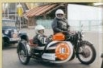
Egy kerék hátréba még nem akasztotta, hogy részt vegyessen a körön utálokocsiak is