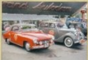
Ezen a Németországból érkezett, nyitólak felül, a távolú Wartburgon még a nyelvenél is eredeti. Perceze a mellette parkoló 1901-es Triumph Racerben Balon sávú „puskóba” a fejedelevi Ralle-Royce-akat hűben imitáló felülvezetésével