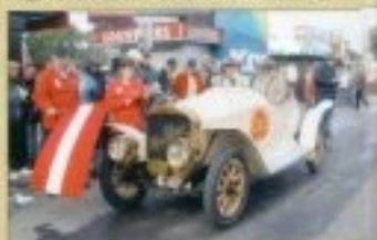
A Czajka házaspár 7-es rajtszámú vörös 1912-es LaurenciKéremtje is előtérben véglegelődte a távol