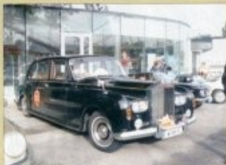
A Kádártólak hátrébr ezal a maszenvalás Phantom V-6e Ralle-Royce-azul vanul ki. A rendezésben emenny úr háttal, kéjemenen vevővel, a háttben csak felülől telefonon tudtak érintkezni egytákkal a több méter hosszú fejedelevi útszakaszon